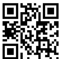
寒河江高校ホームページ