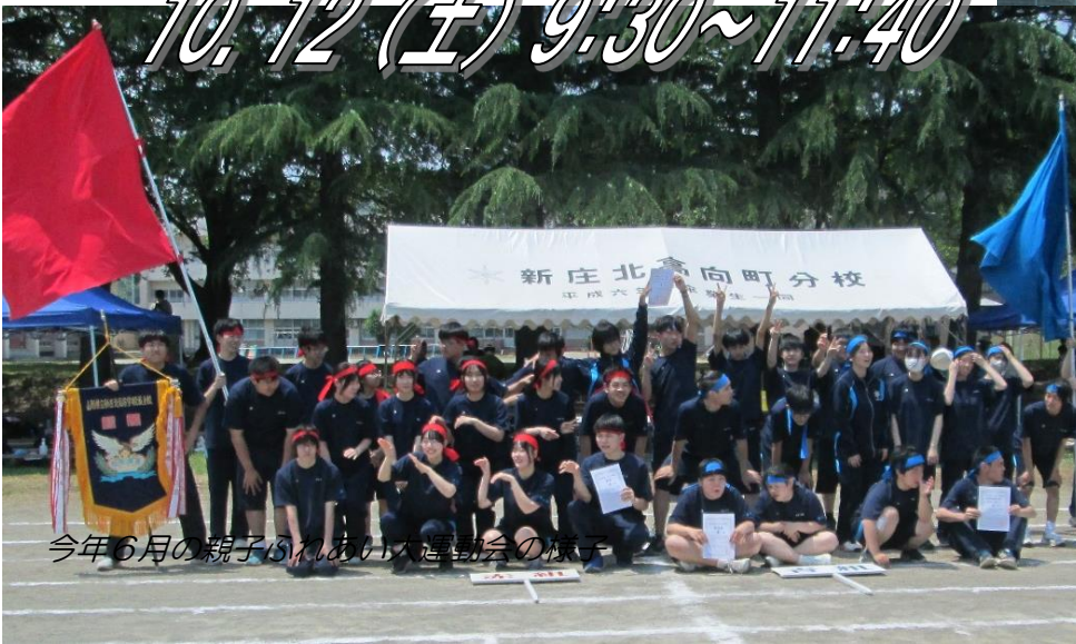
今年6月の親子ふれあい大運動会の様子